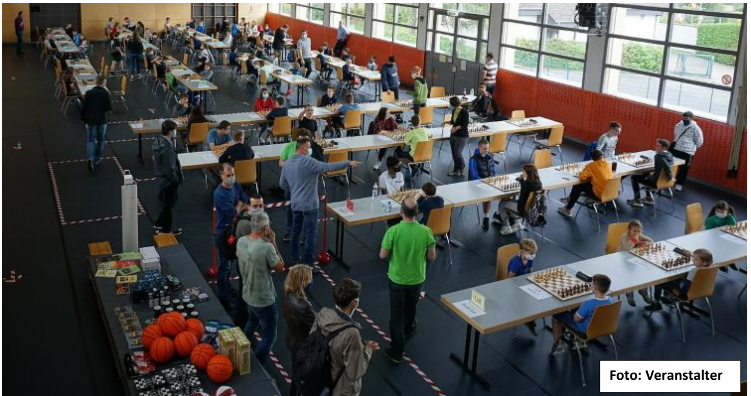
Blick in den Turniersaal, mit Mindestabständen und Mund-Nasenschutz.

7 Runden Schnellschach für Jahrgänge 2002 & jünger